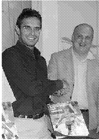
La presentazione della Maratona